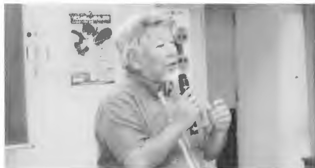
宮良会長あいさつ