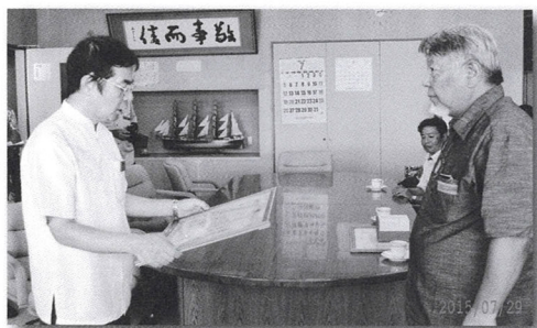
土木建築部長伝達式